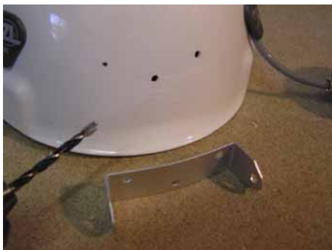
Fori preparati per il supporto della lampada.

Consigliamo di tenere il cavo della lampada all'interno del casco per proteggere meglio la spina.