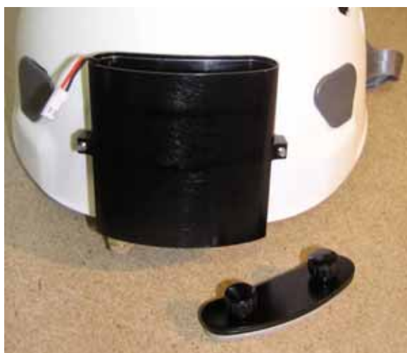
Così viene fissato il cavo