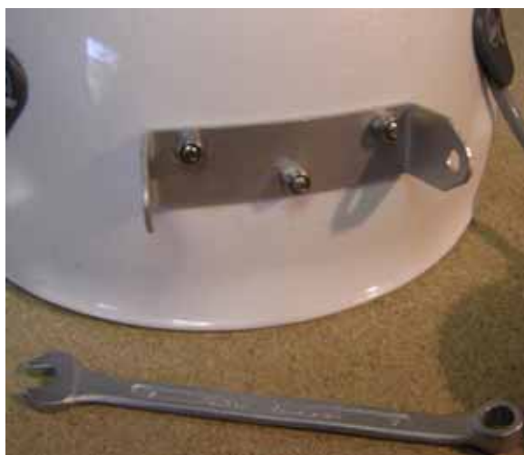
Montaggio completo del supporto.