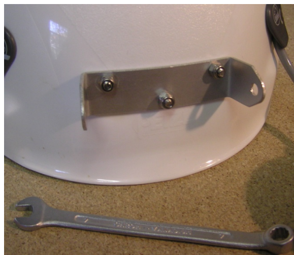
Montaggio completo del supporto