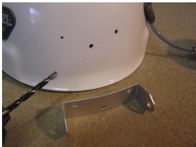
Fori preparati per il supporto della lampada

Consigliamo di tenere il cavo della lampada all'interno del casco per proteggere meglio la spina.