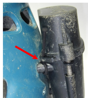
Così viene fissato il coperchio...